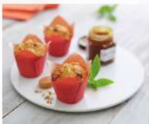
미니 카라멜 머핀